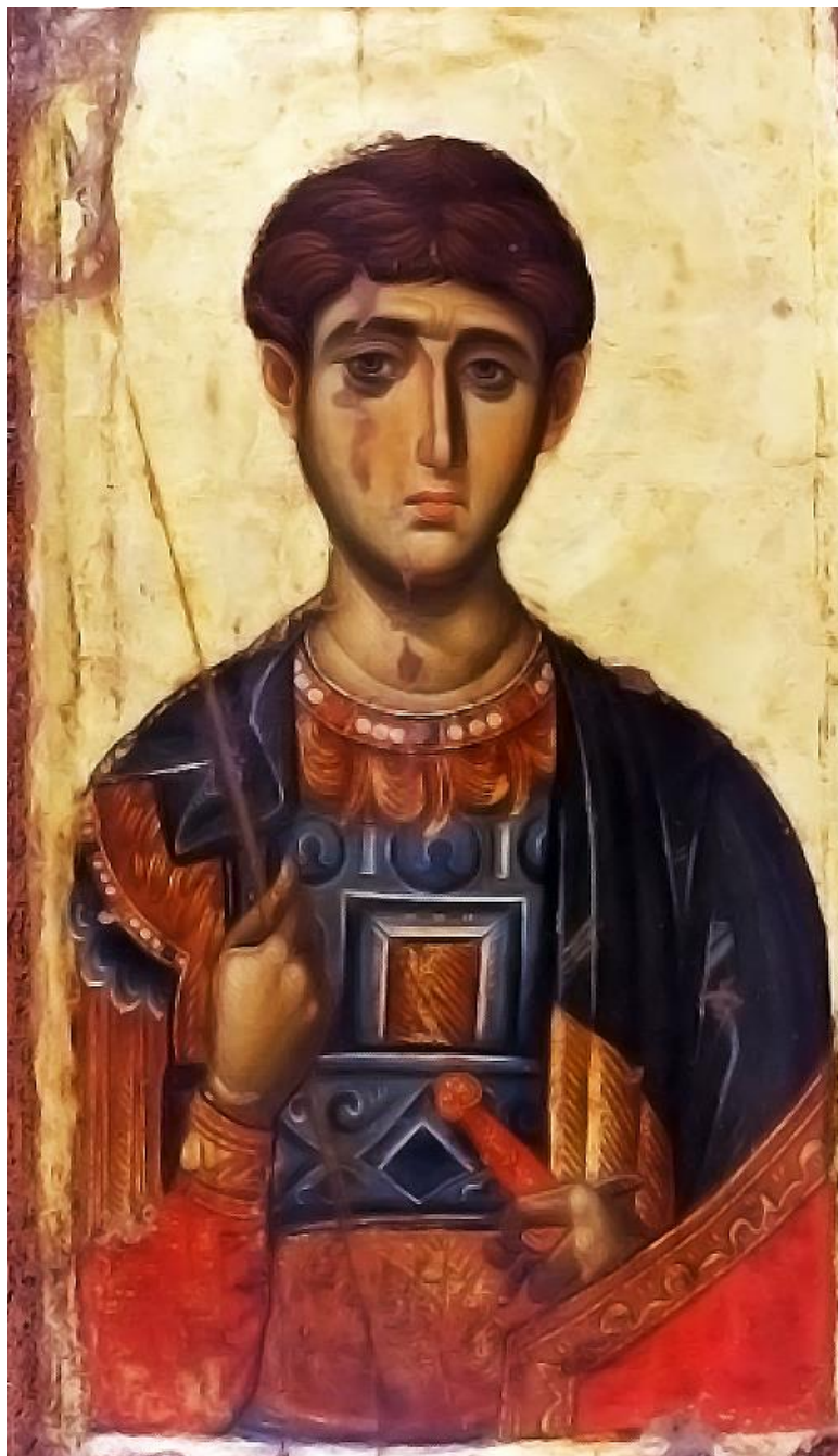
СВ. СВЕТИ ДИМИТРИЙ СОЛУНСКИ ЧУДОТВОРЕЦ